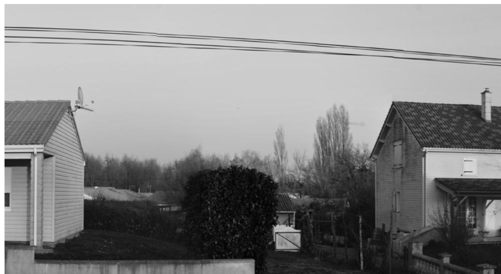
Etat projeté avec esquisse